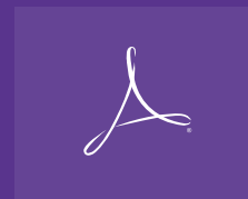
管理 PDF 文件中的 CxF 数据