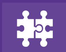
从 CxF 库中查找颜色