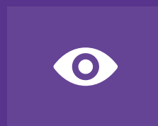
配置监视的文件夹